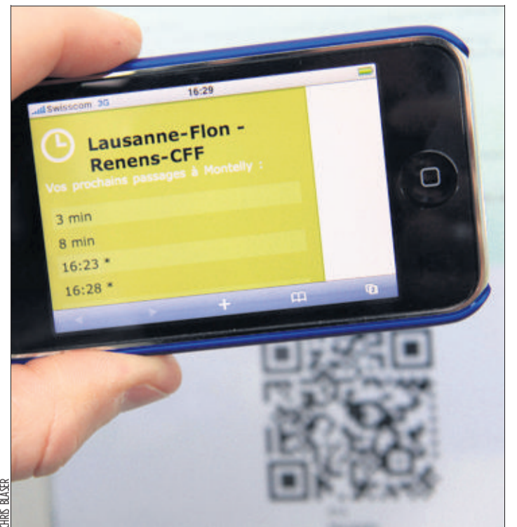
Un téléphone portable configuré pour naviguer sur internet pourrait suffire pour savoir quand arrive le prochain bus dans un avenir proche.

Au mois d'août dernier, deux immeubles (avenue de Cour et rue du Simplon) avaient été touchés par le feu. A chaque fois, il s'était déclaré dans les combles. Aucun indice ne permet de faire le lien entre ces trois sinistres ayant eu lieu dans le même quartier, sous-gare. ALAIN WALTHER