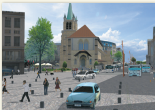
SAINT-FRANÇOIS La place imaginée par les architectes devrait être essentiellement réservée aux piétons ainsi qu'au trafic de bus