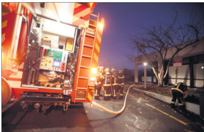
Le feu a été bûté par un toxicomane, sans lien avec l'établissement scolaire. L'incendiaire a été rapidement identifié par la police municipale.