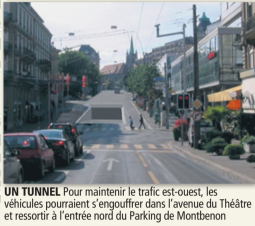
UN TUNNEL Pour maintenir le trafic est-ouest, les véhicules pourraient s'engouffrer dans l'avenue du Théâtre et ressortir à l'entrée nord du Parking de Montbenon